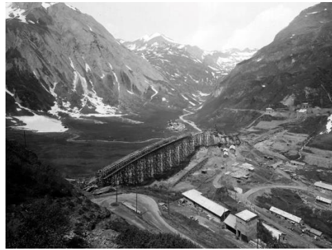
La diga di Morasco in costruzione con villaggio Walser sullo sfondo, foto della mostra "Uomini Macchine Dighe" www.archiviodelverbanocusioossola.com